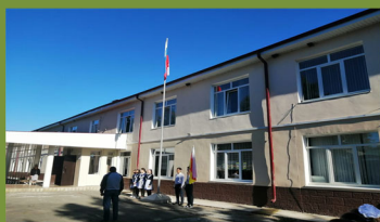
МБОУ СОШ с. Мичурино