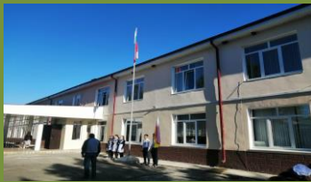
МБОУ СОШ с. Мичурино