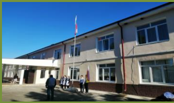
МБОУ СОШ с. Мичурино